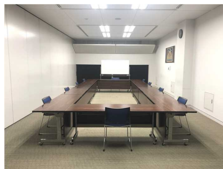
小ホール・中会議室レイアウト例