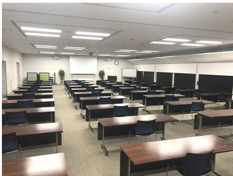
大ホールレイアウト例