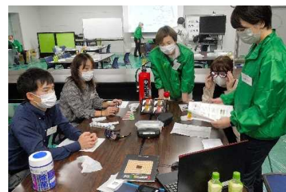
カラーユニバーサルデザイン 疑似体験