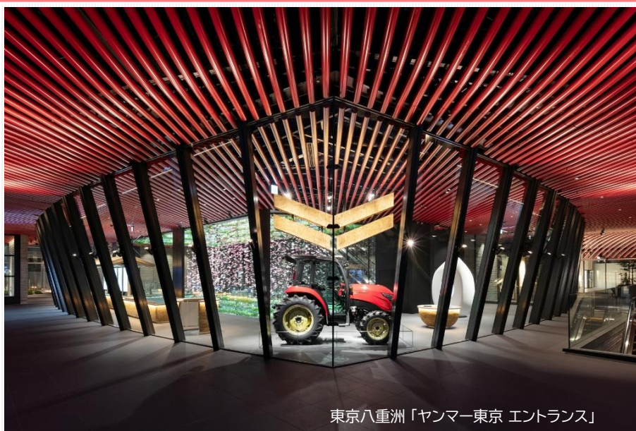
東京八重洲「ヤンマー東京 エントランス」

今年の「色彩セミナー」は、3年振りの東京リアル開催と同時に、WEBセミナーとしてライブ配信し、さらに終了後10日間オンデマンドで配信します。業界トップのプレゼンターをお迎えし、経営や企画・マーケティング視点からも意味のある内容となります。広く塗料・塗装業界の色彩関係者や、色彩に興味のある皆様のご参加をお待ちしています。