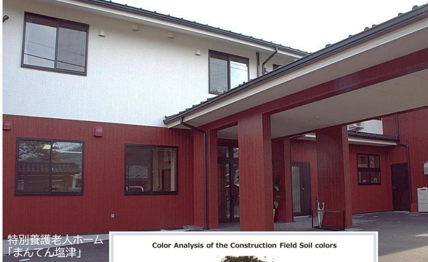
特別養護老人ホーム 「まんてん塩津」