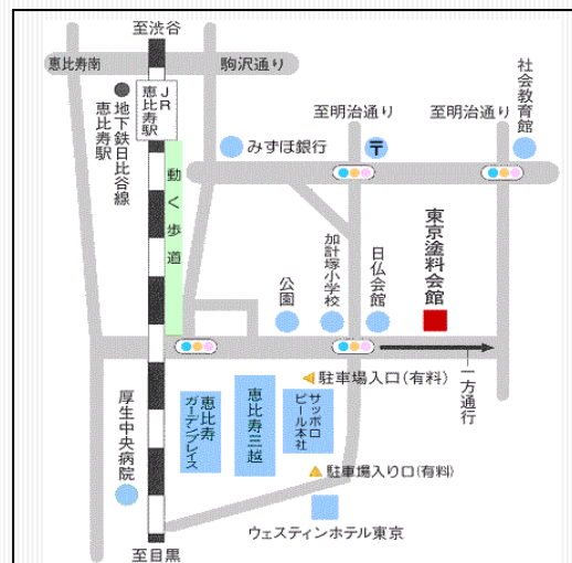
JR山手線/東京メトロ日比谷線恵比寿駅より15分。 東口より動く歩道に乗り左折、直進し左手のビル。

●会場：東京塗料会館 地下会議室 〒150-0013 東京都渋谷区恵比寿3-12-8 TEL03-3443-2011